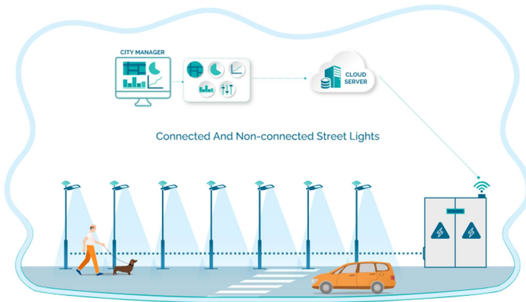
Slika 2. Slikoviti prikaz kompletnog sustava javne rasvjete