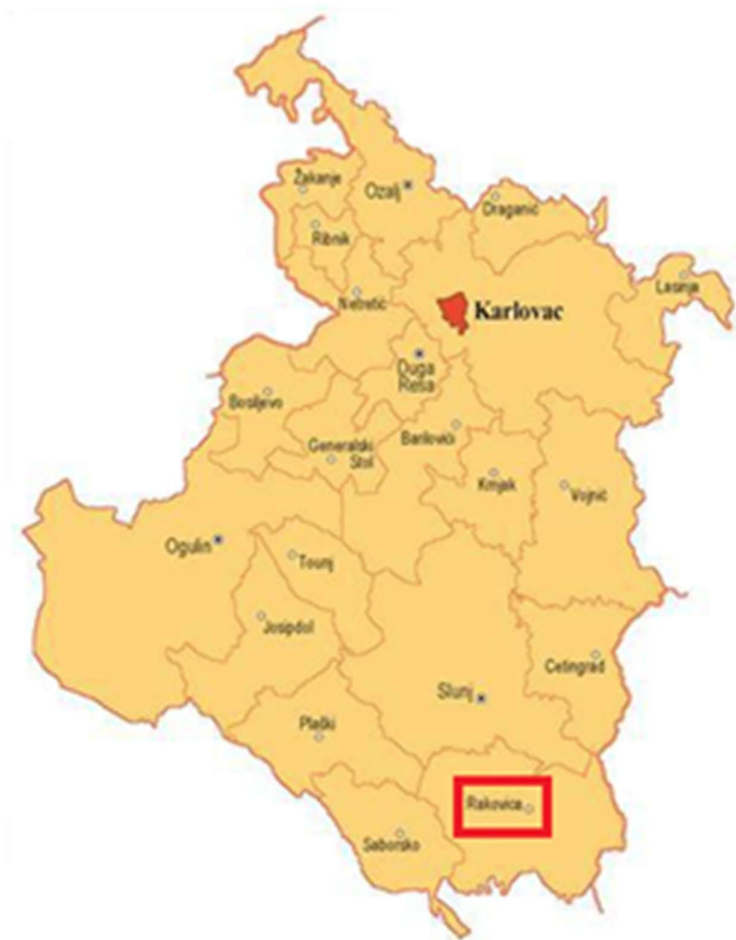
Slika 1. Položaj Općine Rakovica u Karlovačkoj županiji